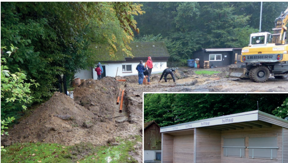
So ging es los: Dort, wo es zu Beginn der Bauarbeiten eher wie eine Schlammwüste aussah, steht heute unser Vereinsheim. Im Hintergrund rechts erkennt man den alten Verpflegungsstand, der nun auch im neuen Glanz erstrahlt.